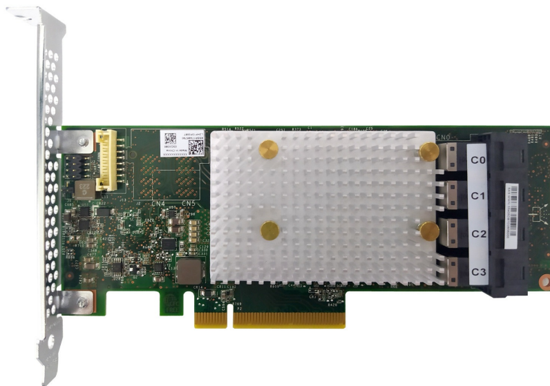
Figure 1. ThinkSystem RAID 9350-16i 4GB Flash PCIe 12Gb Adapter

The ThinkSystem RAID 9350-16i is shown in the following figure.