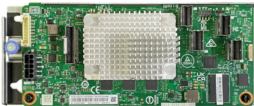
Figure 3. ThinkSystem RAID 9350-16i 4GB Flash PCIe 12Gb Internal Adapter

The following figure shows the ThinkSystem RAID 9350-16i 4GB Flash PCIe 12Gb Internal Adapter